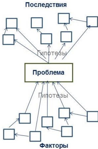
Рисунок 2. – Модель проблемы

В верхней части модели аналогичным образом отображаются последствия проблемы. По сути это ответы на вопросы о том, в чём выражается наша проблема, к чему приводит ее наличие?