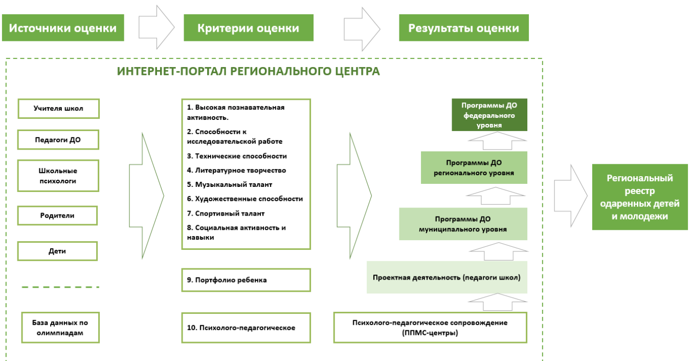
Рисунок 1. – Схема выявления способностей и талантов у детей и молодёжи на территории.

Схема выявления способностей и талантов у детей и молодёжи на территории приведена на рисунке 1.